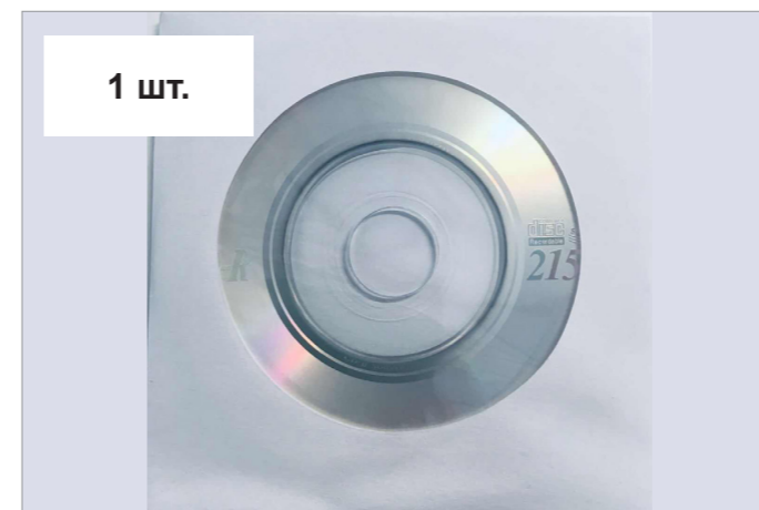
Диск с драйверами