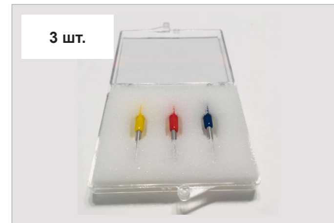
Ножи (тип Roland)