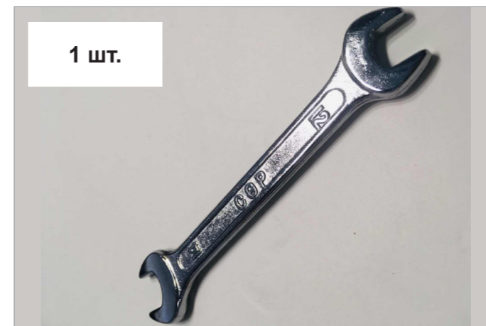
Ключ рожковый 12-14