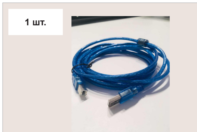
Кабель USB A - USB B