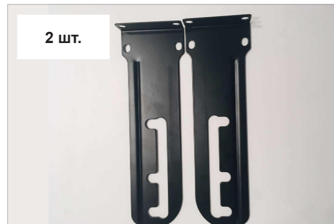
Кронштейн держателя рулона