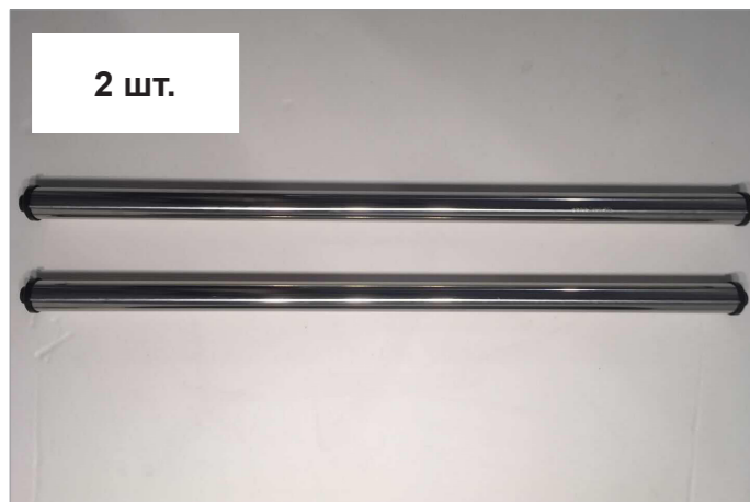
Вал держателя рулона